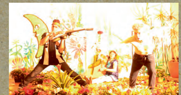
MON COEUR S'EMBALLÉ © Robert Combas & Lucas Mancione