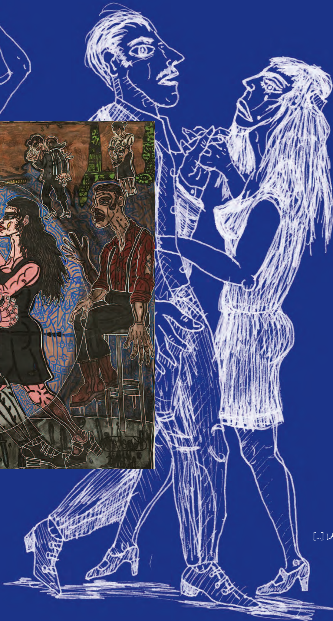
[...] LA MUSE, C'EST UN PEU TOUTES LES FEMMES, C'EST L'INSPIRATRICE DE L'ARTISTE [...]. Robert Combas, 1995

LA VILLE D'ANGERS ACCUEILLE, AU GRAND THÉÂTRE D'ANGERS DU 26 AVRIL AU 25 JUILLET 2014 UNE EXPOSITION DE