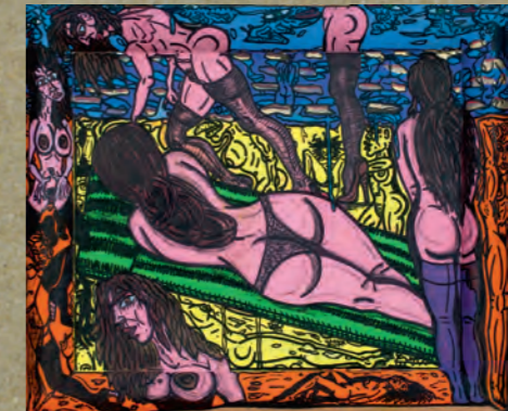
LES NEZ SONT TOUJOURS LA MÊME 1989 Acrylique sur toile et bois, 76 x 88,5 cm © Robert Combas