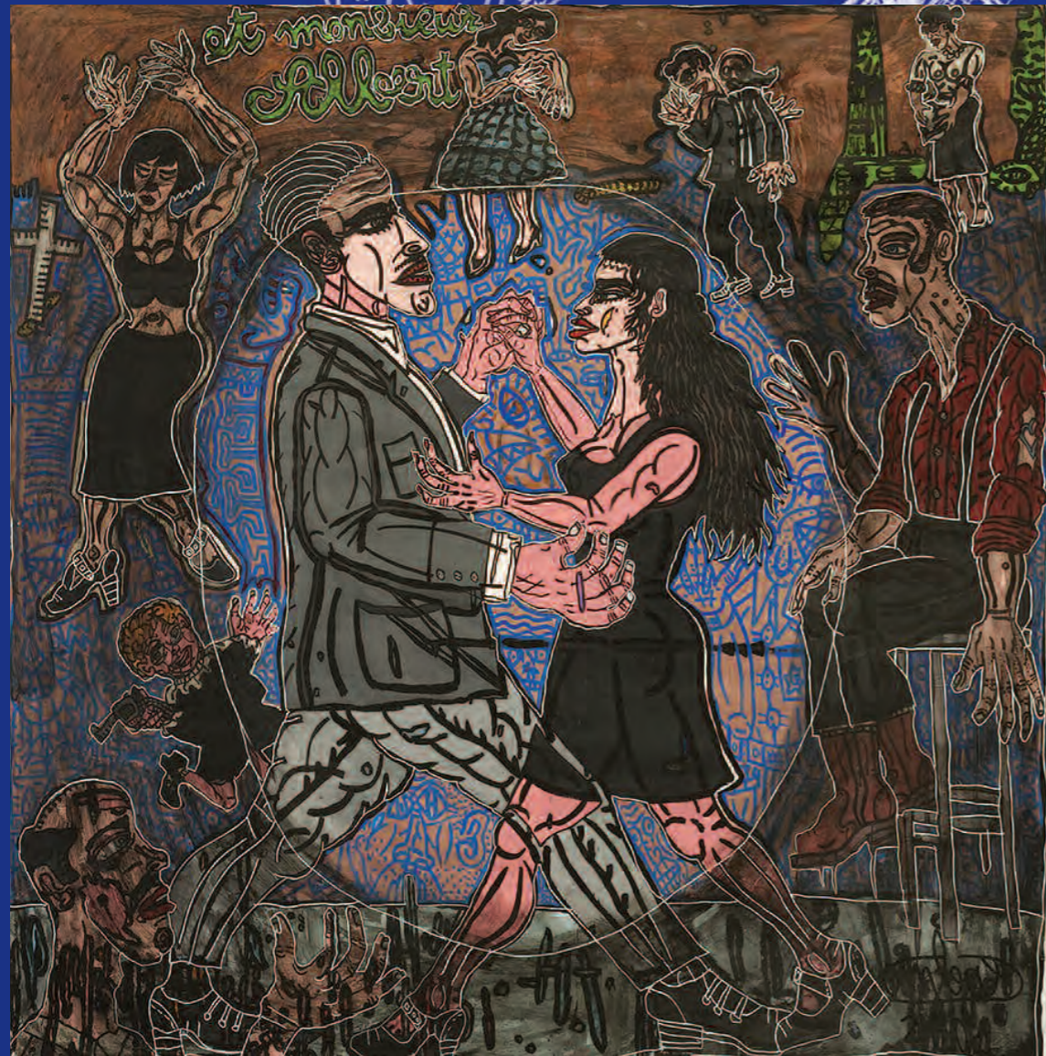
LE GLOBE Acrylique sur toile, 235 x 235 cm, 1988-2007