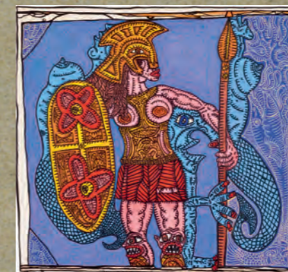
GENEVIÈVE GUERRIÈRE AMAZONE LES NICHONS DÉCOLLÉES 1987 Acrylique sur toile, 137 x 145 cm © Robert Combas - Courtesy Galerie Laurent Strouk Paris