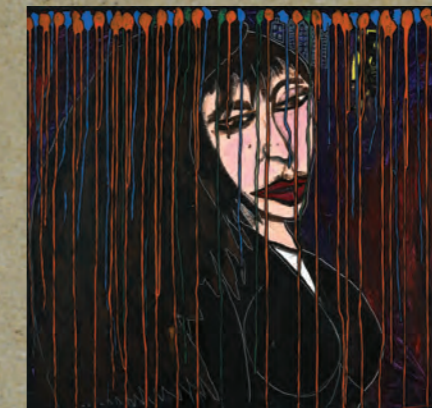
FEMME MÉLANCOLIQUE PENSANT À QUELQUE CHOSE DE PRIVÉ 1994 Acrylique sur toile, 100,5 x 107 cm © Robert Combas