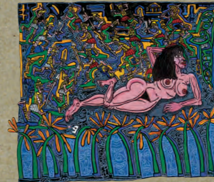
Portrait de Geneviève ma fiancée en Princesse du Sud 1987 Acrylique sur toile, 195 x 230 cm © Robert Combas

visuels HD libres de droits disponibles sur http://presse.angers.fr/