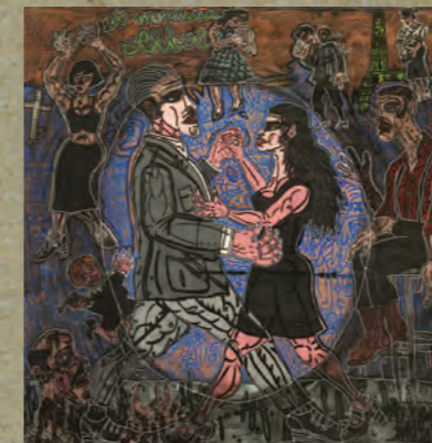
LE GLOBE 2007 Acrylique sur toile, 235 x 235 cm © Robert Combas